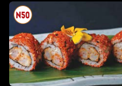
N50 Camarão Spicy ..... 8,95€