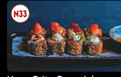
N33 Hoso Frito Especial (8p)..... 8,95€