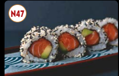
N47 Maki de Salmão e Abacate ..... 6,95€