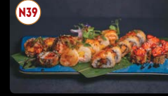
N39 Combinado Hot (20p) ..... 18,00€