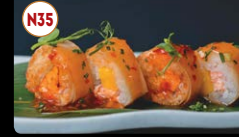
N35 Harumaki Frito (10p) ..... 10,00€