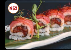
N52 Spicy Atum ..... 9,95€