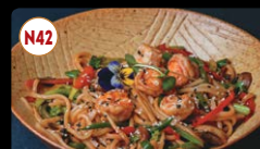
N42 Yakisoba com Frango ou Camarão ..... 10,95€