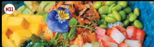
N31 Sake ..... 9,95€