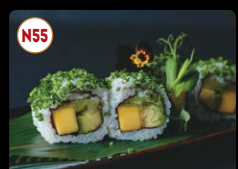
N55 Vegetariano ..... 7,95€