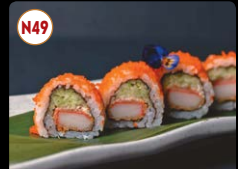
N49 Kani Maki ..... 8,95€