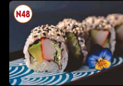
N48 Califórnia Clássico ..... 8,95€