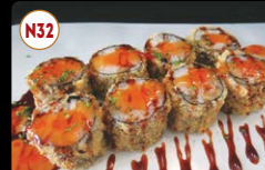
N32 Hoso Frito (16p) .... 10,00€