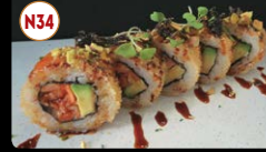
N34 Uramaki Frito (10p) ..... 10,00€