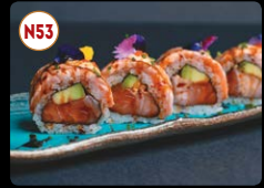
N53 N.O. A Especial ... 12,00€