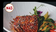
N43 Salmão Teriyaki ..... 12,95€