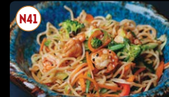
N41 Massa de Frango / Porco / Camarão ..... 8,95€