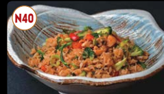
N40 Arroz Chau-Chau de Frango / Porco / Camarão ..... 8,95€