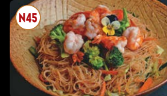
N45 Massa Fina de Frango / Porco / Camarão ... 8,95€