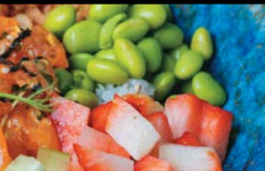
Maguro ..... 10,95€