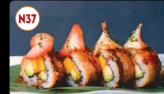
N37 Vegetariano Frito (10p) ..... 8,95€