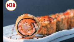
N38 N.O. A Hot (8p)..... 9,95€