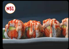
N51 Volcano Maki ..... 8,95€