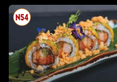
N54 Dragon Maki ..... 12,00€