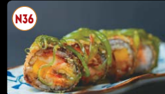
N36 Futomaki Frito (10p) ..... 12,00€