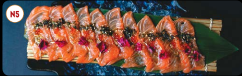
N5 Carpaccio Sake (10p) ..... 7,95€