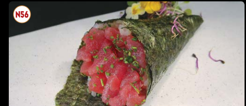
N56 Sake ..... 4,50€