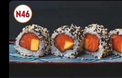
N46 Maki de Salmão e Manga ..... 6,95€