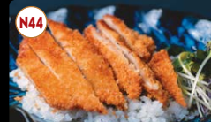
N44 Frango Panado ..... 8,95€